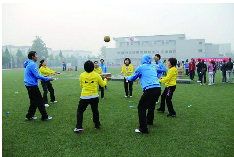
图 3 击鼓颠球

4. 毛毛虫接力： 比赛时每队 8 人（其中至少包含 2 名女队员），距离为 20 米，4 名队员在起点处站成一路纵队，每队每人手持毛毛虫拉手；进行比赛。竞赛方法：比赛开始后，8 人分成两组，每队 4 名队员从起点，前进