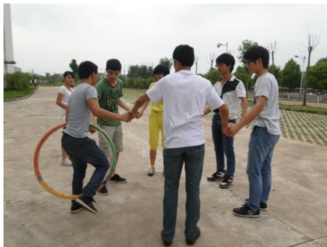
图 2 穿越彩虹

3. 击鼓颠球： 比赛时，每队 10 人（其中至少包含 2 名女队员），一名队员将排球放在同心鼓上，其余 9 人手握绳的末端，一起颠球。1 分钟内按颠球次数多少录取名次（图 3）。