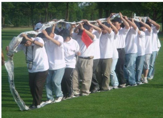
图 2 履带战车

2. 履带战车 :比赛时, 每队 10 人 (其中至少包含 2 名女队员), 队员站在履带上, 开动履带前进, 以全部履带通过 15 米终点线为准, 计时停止。在活动过程中, 有 1 人脚掌接触地面, 将本队成绩加时 5 秒, 2 人脚掌接触地面, 加时 10 秒计算。比赛结束, 以计时时间长短确定名次。若出现队伍比赛时间相同, 相同的队伍进行加赛, 直至决出名次。(图 2)