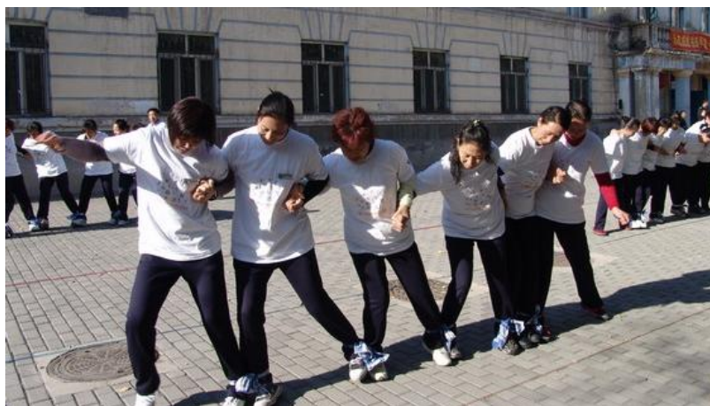
图 1 蛟龙出海

2. 履带战车 :比赛时, 每队 10 人 (其中至少包含 2 名女队员), 队员站在履带上, 开动履带前进, 以全部履带通过 15 米终点线为准, 计时停止。在活动过程中, 有 1 人脚掌接触地面, 将本队成绩加时 5 秒, 2 人脚掌接触地面, 加时 10 秒计算。比赛结束, 以计时时间长短确定名次。若出现队伍比赛时间相同, 相同的队伍进行加赛, 直至决出名次。(图 2)